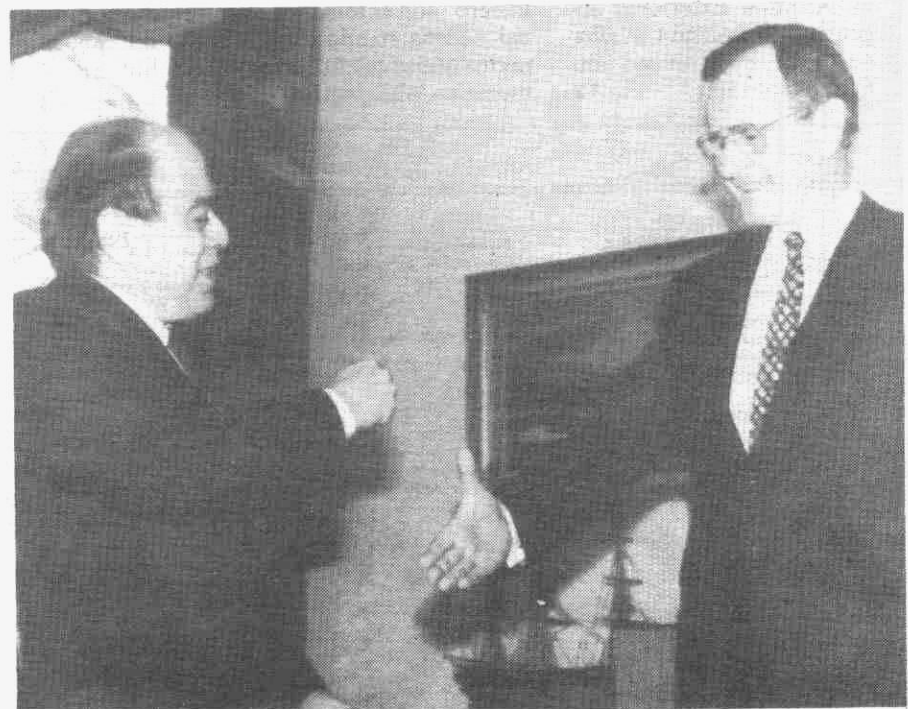
Jordi Pujol saluda a George Bush en la Casa Blanca

WASHINGTON. — Jordi Pujol ha calificado de "interesante, agradable y cordial" el breve encuentro mantenido ayer en el despacho oval de la Casa Blanca con el presidente de los Estados Unidos, George Bush. El presidente de la Generalitat, que se encuentra de viaje oficial en los EE.UU., declaró que la entrevista fue "muy útil para explicar qué es Cataluña dentro de España" al presidente norteamericano, al que también expuso la contribución de Cataluña y España a la estabilidad y equilibrio del área mediterránea y al progreso económico del sur de Europa. PÁGINA 11