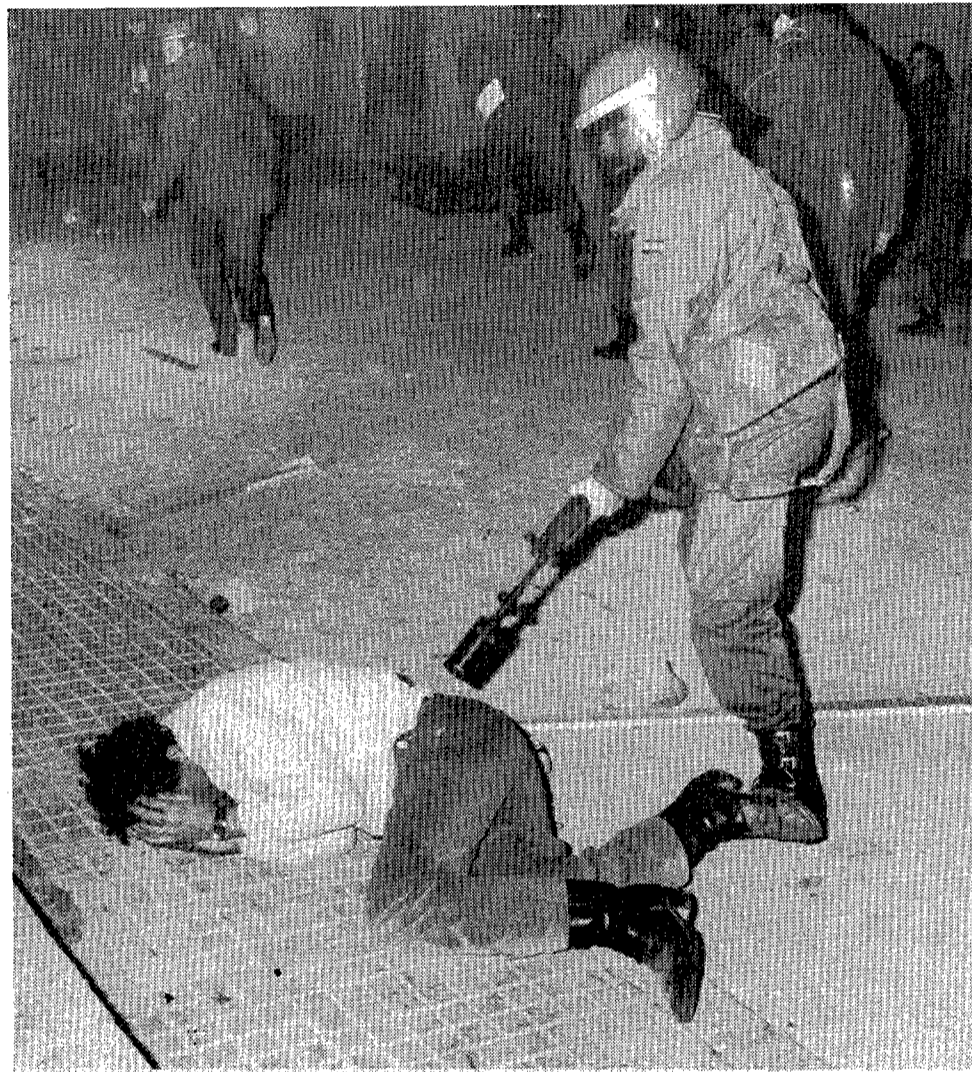
Los efectivos de la Guardia Civil intervinieron en Montblanc