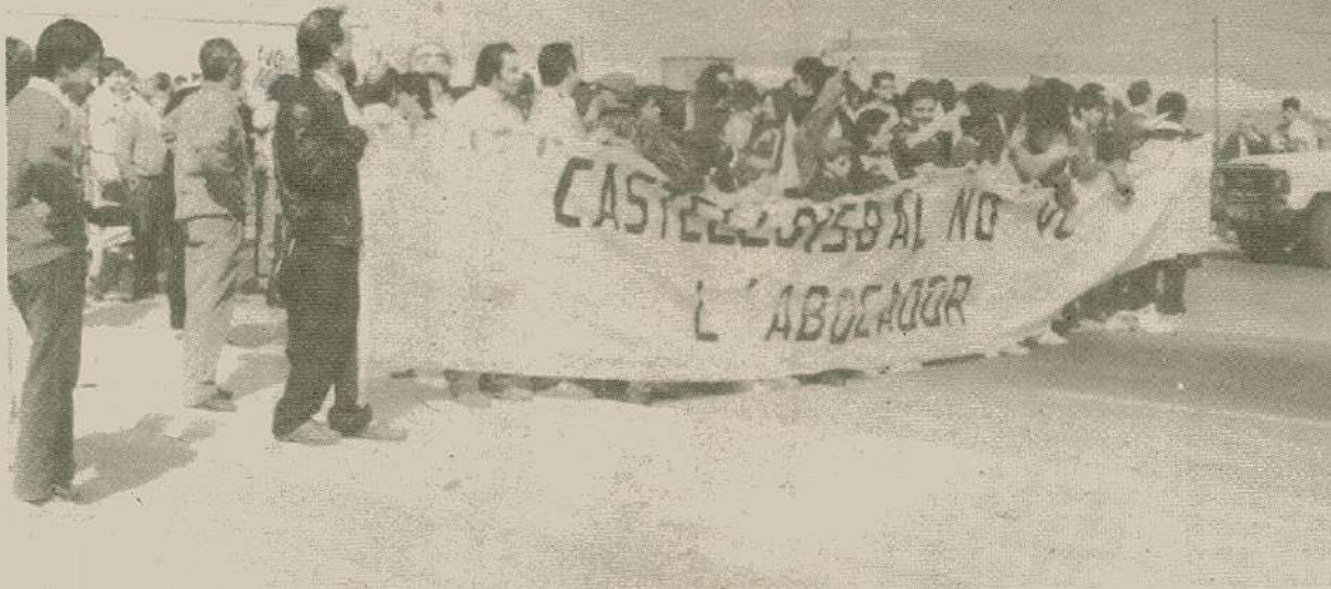
Els veïns de Castellbisbal van tallar ahir la nacional N-II en protesta pel pla de residus

També prop de mil veïns del Pla de Santamaria, a l'Alt Camp, van concentrar-se ahir en protesta pel pla de residus i van tallar l'autopista A-2 sense que hi hagués cap incident.