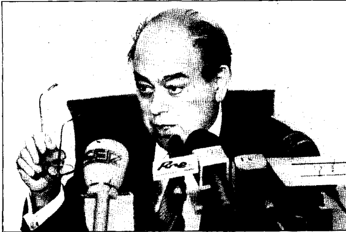
El President Pujol es va reunir amb una delegació d'alcaldes de la Conca de Barberà contraris a la instal·lació d'un abocador de residus industrials a Forès.