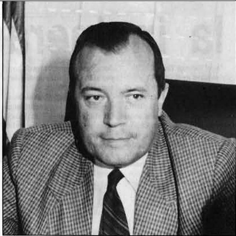
popular i tindrà en compte la situació creada abans d'adoptar una decisió definitiva."

Finalment, el President del Consell Comarcal de l'Alt Camp manifestava la seva confiança i esperança en una resolució positiva del tema: "hem de ser conscients que, malgrat tot, la incineradora podria acabar instal·lant-se a la nostra comarca. Però els ciutadans de l'Alt Camp tenim tota l'íntima confiança que el Consell Executiu serà sensible a aquest clam popular i tindrà en compte la situació creada abans d'adoptar una decisió definitiva."