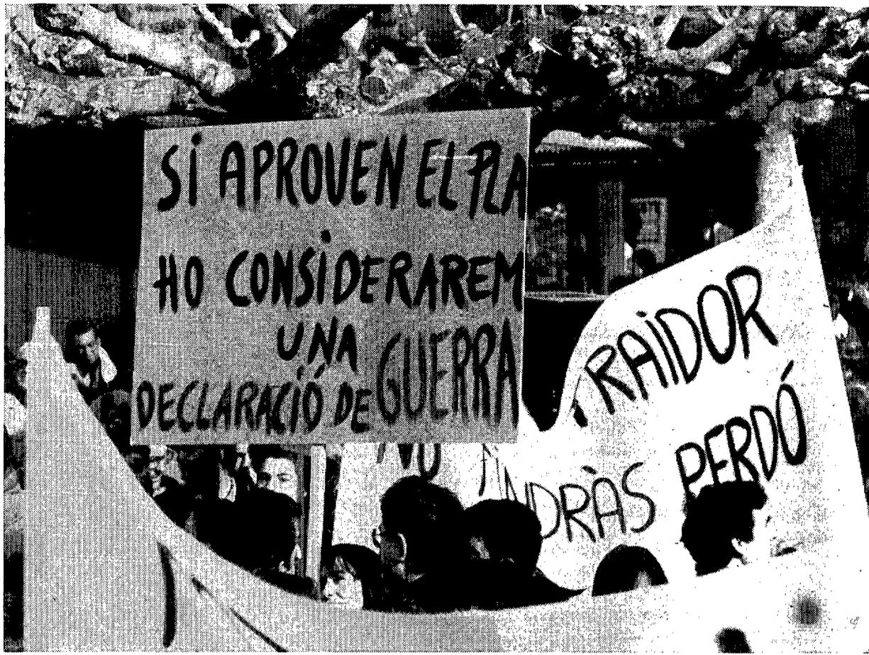
Los habitantes de la Conca de Barberà se han movilizado contra el Plan de Residuos