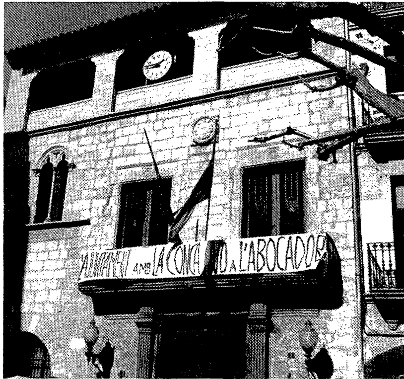
El plan de residuos movilizó a toda la Conca de Barberà

El proceso empezó a materializarse pocos días después con la creación de la primera comisión gestora, la de Solivella, y la toma de posesión